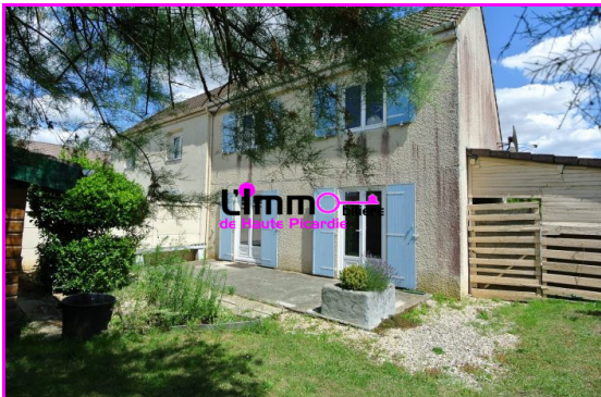
Arrière de la maison